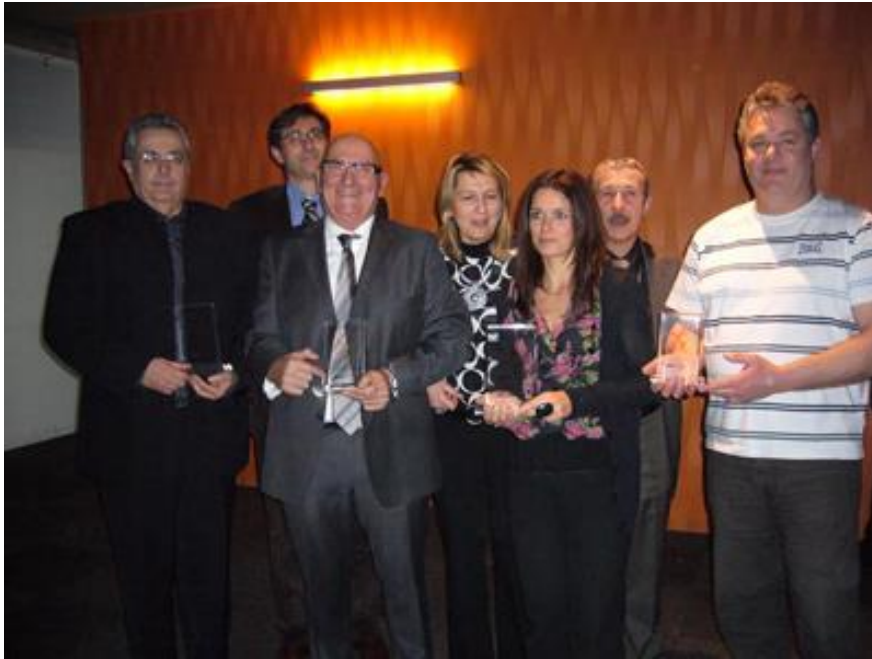
Remise des trophées des Fauteuils d'Or (avril 2009)