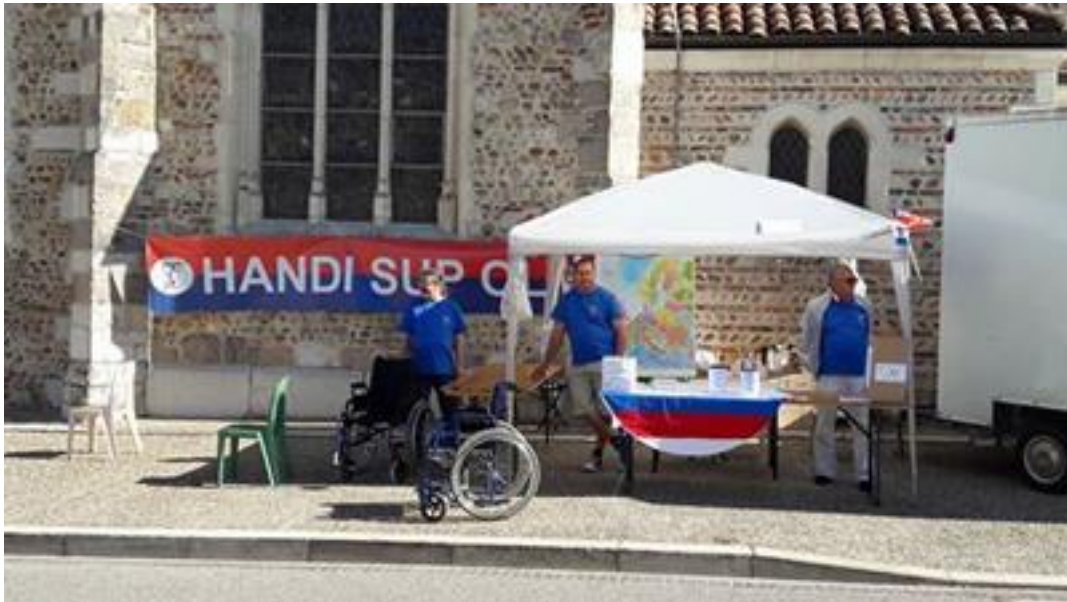
Stand pour la sensibilisation aux handicaps lors du village du tour de France à Villars Les Dombes le 16 juillet 2016.