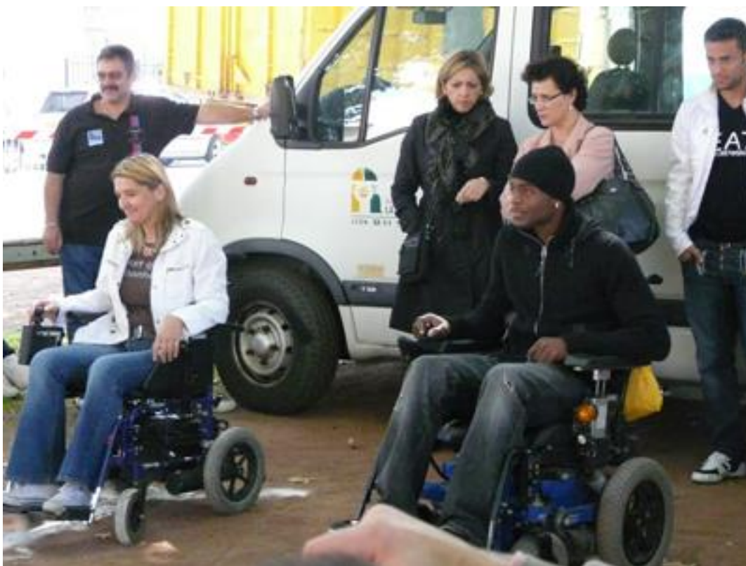
Course de fauteuil pour sensibiliser les personnes valides à l'utilisation d'un fauteuil électrique (mars 2007).