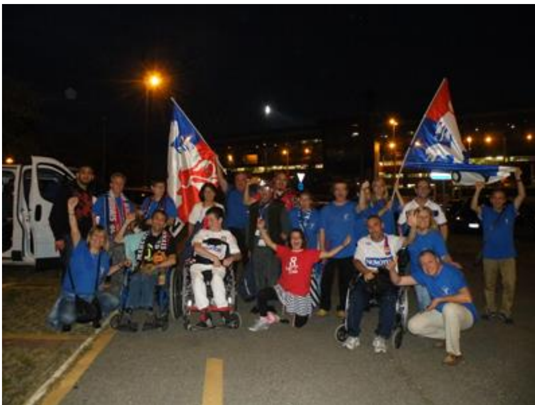
28 membres de l'association (17handis et 11 accompagnateurs) ont fait le déplacement à Reggio d'Emilia pour la finale de la ligue des champions féminines le 26 mai 2016.