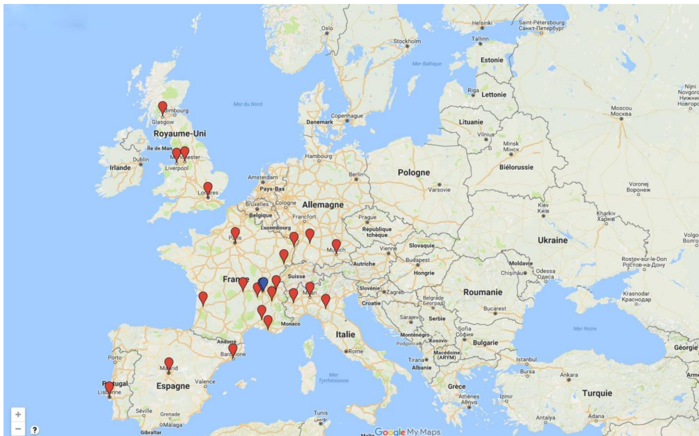
Carte des déplacements faits depuis la création de l'association.

Le plus gros déplacement a été fait à Turin avec 36 personnes dont 20 PSH.